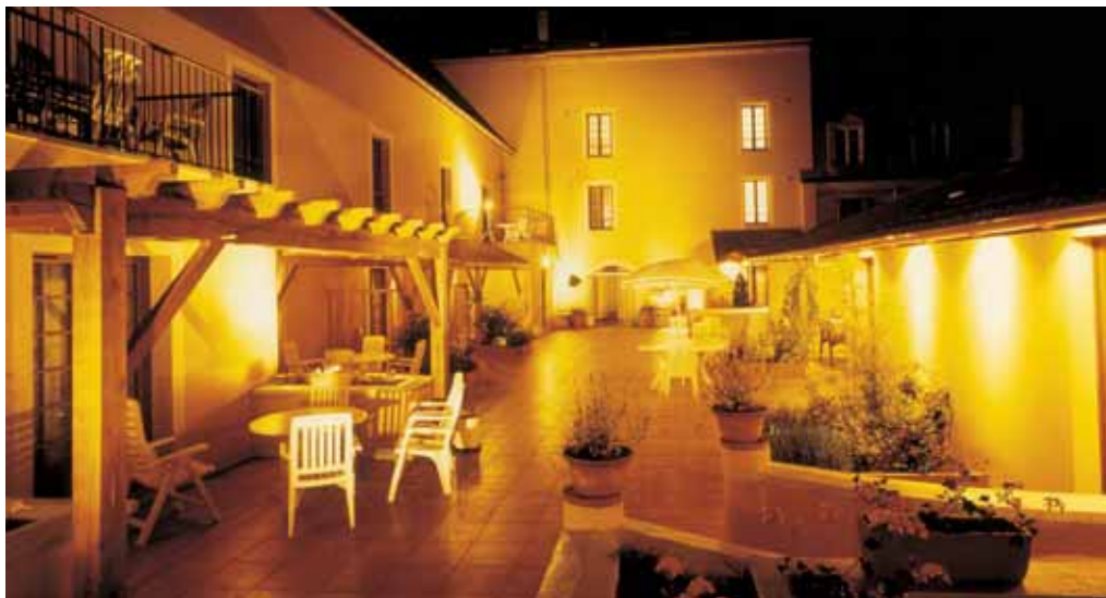
Terrasses intérieures de nuit.