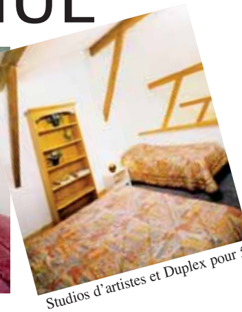
Studios d'artistes et Duplex pour 5